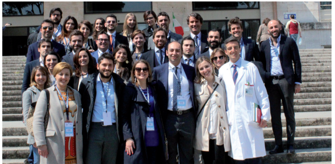
LA VISITA DI UNA STRUTTURA DURANTE LA CONSULTA NAZIONALE ON THE ROAD IN CAMPANIA, APRILE 2017

vembre scorso - che continuerà nella sua analisi anche quest'anno a Palermo, per avere gli elementi per programmare anche in Italia i necessari correttivi, al fine di rilanciare la sanità del nostro Paese. Ci siamo riuniti in tante Consulte e abbiamo trovato sinergie con altri